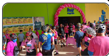
Pedal Rosa: Arrecadação líquida de R$4.957,00