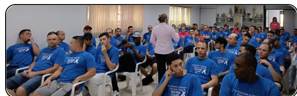
Novembro Azul: Arrecadação líquida de R$3.339,95