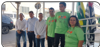
McDia Feliz: Arrecadação líquida de R$62.680,72