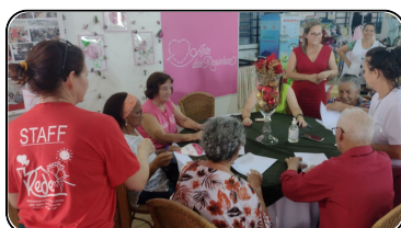
Festiva de Natal